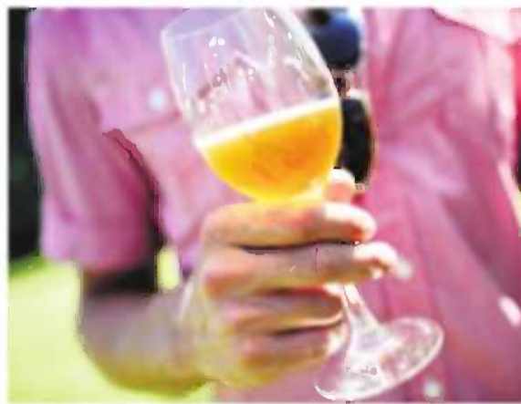
Øl fra Herslev Bryghus brygget på de berømte gulerødder fra Lammefjorden.