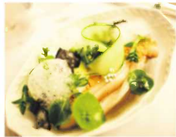
Rå knivmuslinger med strandurter og sauce på brændt hø.